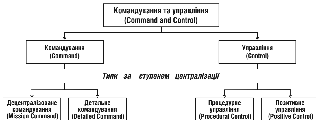
Рис. 3. Типізація командування та управління за ступенем централізації

Командування (як функція) є поняттям структурно неоднорідним і складається з компонентів та елементів (див. рис. 2).