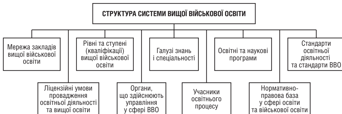
Рис. 1. Структура системи вищої військової освіти

членів НАТО щодо перспектив розвитку військової освіти та розв'язання проблем її функціонування.