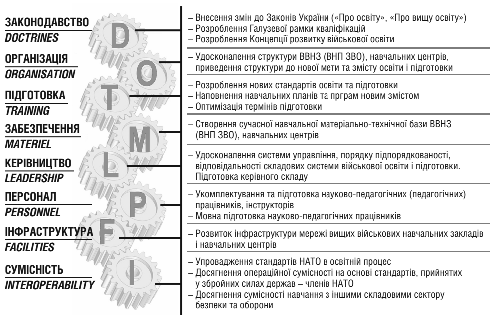
Рис. 1. Базові компоненти проекту управління змінами щодо розвитку системи військової освіти

Формування базових компонентів і завдань проекту здійснено за методологією DOTMLPFI ( Doctrines, Organization, Training, Materiel, Leadership, Personnel, Facilities, Interoperability ). Розгляньмо їх детальніше (рис. 1).