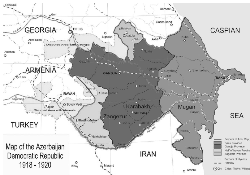
Рис. 3. «Великий Азербайджан» [14]

Безумовно, зазначені концепції не є офіційними. Але, як впливає з порівняння аналогічних поглядів, існуючих у Польщі, Угорщині або Румунії, та головного вектора їх зовнішньополітичних кроків, складається стійке враження, що концепції «великих країн» певним чином слугують орієнтиром у їхній зовнішній політиці. Можна стверджувати, що в разі сприятливого збігу обставин напрям поширення територіального впливу буде саме такий, як передбачає відповідна концепція.