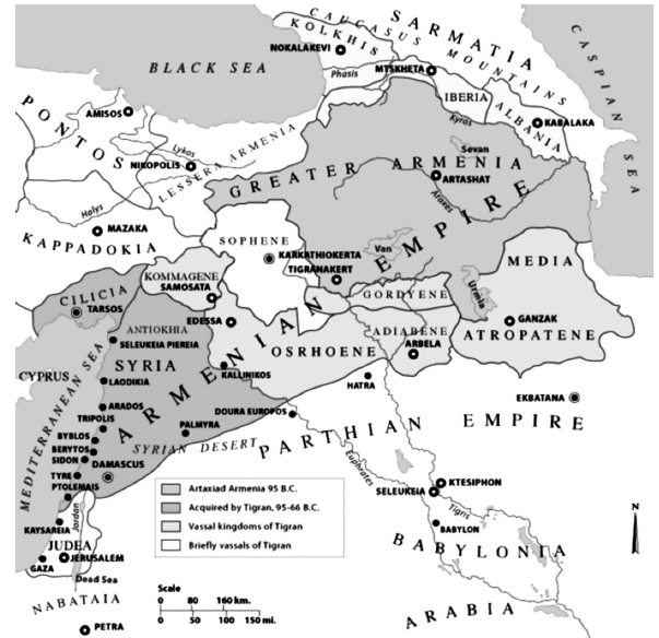
Рис. 2. «Велика Вірменія» [13]