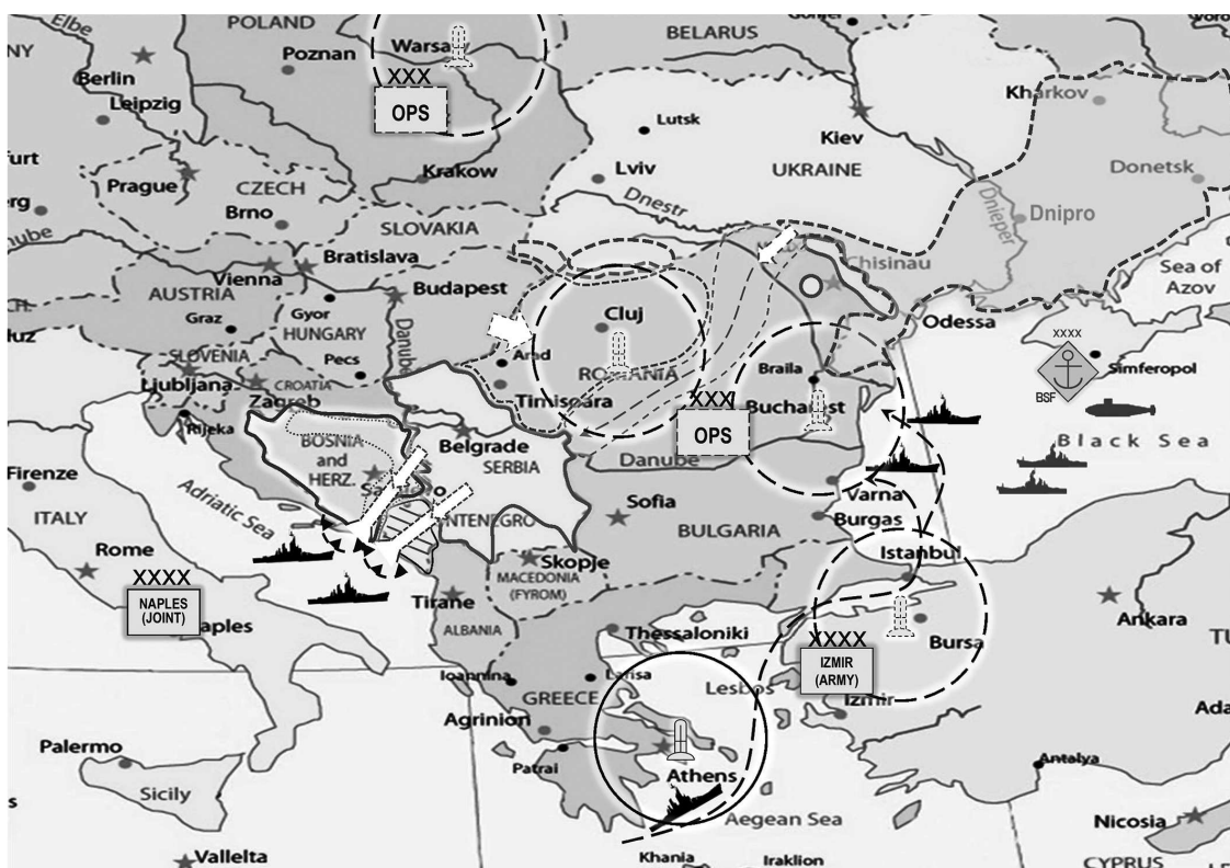
Рис. 5. Моделювання можливих дій РФ на Балканах

Республіки Крим як таких, які перебувають поза межами Росії.