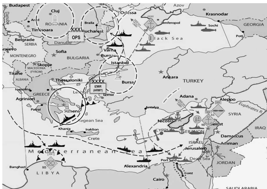
Рис. 3. Формування системи присутності РФ у дальній операційній зоні

У регіоні Середземного моря прогнози дають підстави стверджувати, що Росія шляхом утримання військово-морських та авіаційних баз продовжить збереження своєї присутності. Одним з завдань для Росії є отримання можливості гарантованого використання Суецького каналу своїми бойовими кораблями як альтернативного маршруту виходу до Середземного моря (рис. 3). Про це свідчать наміри Росії щодо безпосередньої участі в модернізації та розвитку каналу, інвестування відповідних проектів, отримання статусу їх співвласника, а також створення військово-морської бази на сході Лівії, як це вона зробила в Сирії (база ТАРТУС). Не виключається можливість розгортання там ядерного озброєння.