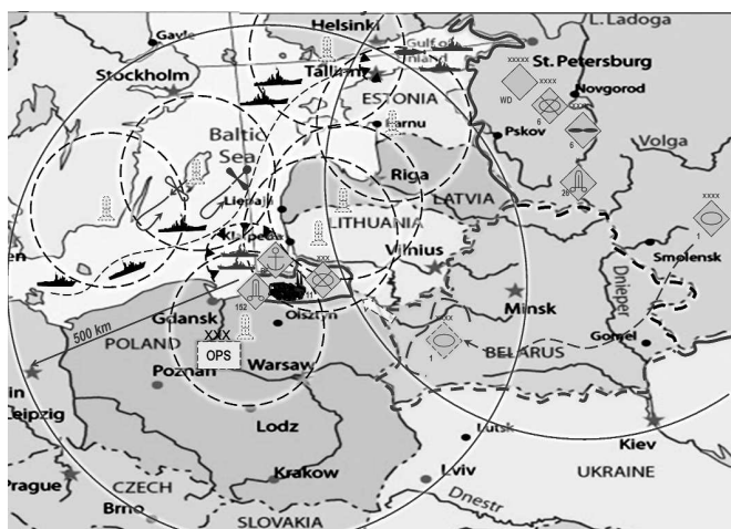
Рис. 2. Моделювання можливих дій Росії в Балтії

У Балтії можливою метою дій Росії є створення сухопутного коридору до Калінінградської області з території Республіки Білорусь і відрізання країн Балтії від країн НАТО (рис. 2). Згідно зі сценаріями масштабних спільних навчань збройних сил Росії та Білорусі (типу «Запад») це завдання може бути покладене на 1-шу танкову армію Західного військового округу. Розгортання ракетних комплексів «Іскандер» у Калінінградській області, а також наявність там систем протиповітряної оборони С-400 сприятимуть створенню зони обмеженого доступу, що внеможливить швидке реагування основних сил НАТО на дії російських військ у країнах Балтії. Не виключається вірогідність розгортання на території Білорусі ракетних комплексів «Іскандер».