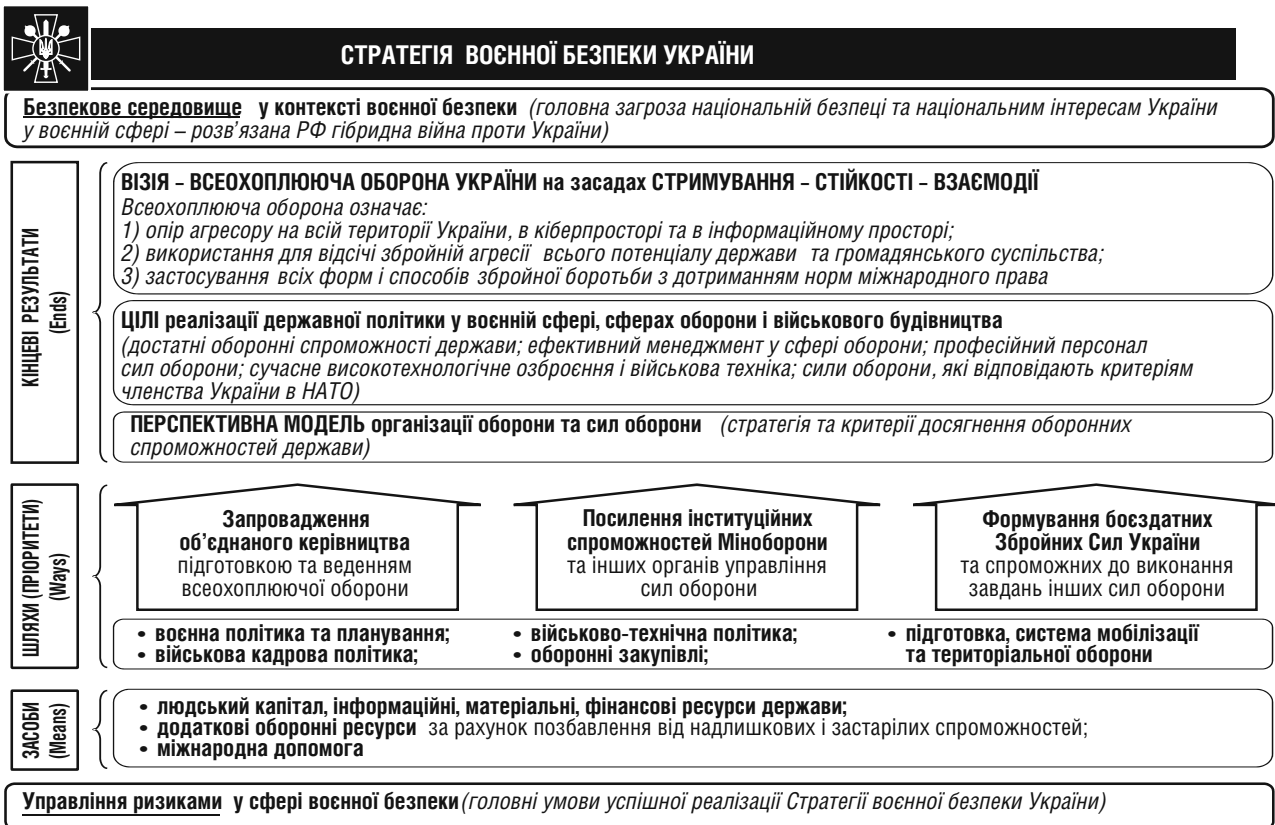
Рис. 1. Візуалізація положень Стратегії воєнної безпеки України

привело б до надмірної мілітаризації держави, а передбачає підтримання певного балансу та синергії воєнних і невоєнних засобів для забезпечення воєнної безпеки України [18].