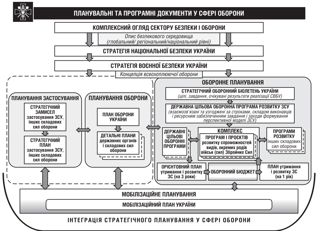
Рис. 4. Інтеграція стратегічних і програмних документів розвитку Міністерства оборони України, Збройних Сил України та інших складових сил оборони України і документів планування оборони

1) внесення змін до Законів України «Про національну безпеку України», «Про оборону України» та «Про Збройні Сили України» в частині, що стосується оптимізації процесів планування у сферах національної безпеки та оборони з урахуванням досвіду держав – членів НАТО і Європейського Союзу;