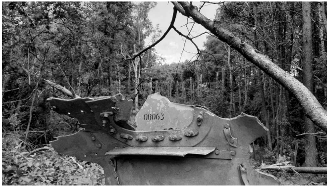
Рис. 13. Фото роботи пошукової групи

виявлені музейно-експедиційною групою в лісовому масиві. Поряд з мистецькою роботою представлено фото роботи пошукової групи (рис. 13).