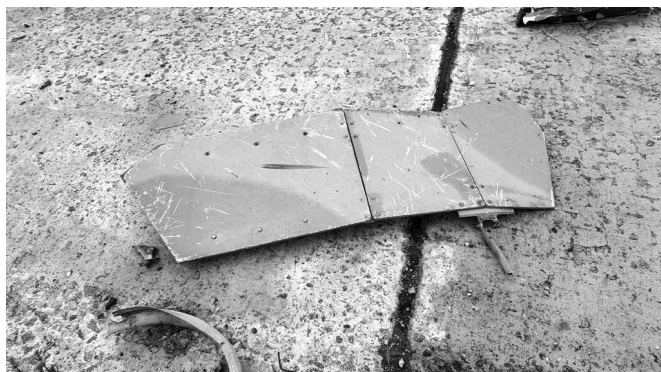
Рис. 4. Фото частини гвинтокрила Мі-8

для роботи, то воно є частиною знищеного неподалік села Копилів Київської області артилерією Збройних Сил України російського танку Т-72Б3 [14].