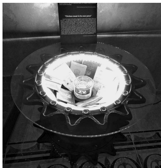
Рис. 11. Мистецька інсталяція «М'ясо кур в собственном соку»