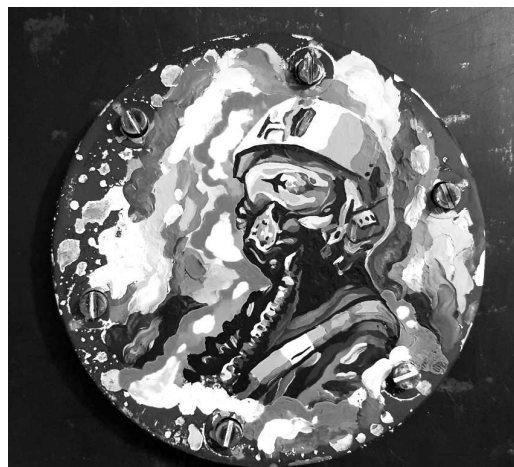
Рис. 17. Художня робота «Привид Києва»

Інтерактивна частина виставкового проєкту «Сталеві полотна» представлена у фото та відеопрезентації, що транслюється на моніторі. До уваги відвідувачів пропонуються оригінальні відеохроніки, відзняті самими окупантами під час висадки десанту на гостомельський аеродром, відео та фотофіксація роботи музейно-експедиційної групи, а також світлини, що ілюструють підготовку виставки.