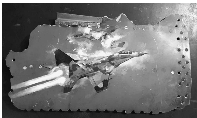
Рис. 12. Художня робота «Залізні янголи»

абсолютно звичайний на перший погляд предмет є надзвичайно цікавим через наявні на ньому хворобливі гасла російської пропаганди та символи новітнього нацизму – Z та V. Нацистська ідеологія, яка, здавалось би, була переможена в Європі в далекому 1945 р., у новій формі відродилась у сучасній Росії та фактично стала її державною ідеологією [23]. Поряд з консервою до уваги відвідувачів виставкового проекту представлені ідентифікаційні жетони, паспорти та військово-облікові документи російських окупантів.