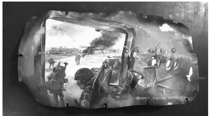
Рис. 2. Художня робота «Аеропорт “Антонов”»

Унікальність виставкового проєкту полягає у використанні для створення художніх робіт та інсталяцій оригінальних елементів ворожої техніки, що були належним чином зафіксовані й атрибутовані під час пошукових робіт, здійснюваних музейно-експедиційною групою при НУОУ [10]. Тож кожна художня робота є частиною конкретного бойового епізоду російсько-української війни. У рамках кожного блоку представлені ілюстрації роботи експедиційної групи та музейні предмети в процесі виявлення та комплектування.