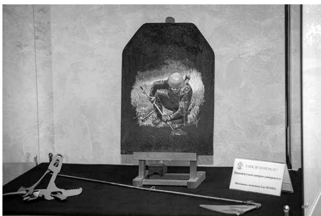
Рис. 9. Художня робота «Сапери НУОУ»

пов'язаний з пам'яттю про іловайську трагедію, а його символом стала квітка соняха. Але в мистецькій інсталяції Олександри Нетьосової квіти соняха набувають дещо нових сенсів – це насамперед продовження нового життя та справедлива відплата, що отримає кожен окупант, який прийшов на нашу землю. Композиційною основою для мистецької інсталяції «Квіти життя» (рис. 10) стали гільзи до російських артилерійських снарядів, виявлені членами музейно-експедиційної групи на території гостомельського летовища у квітні 2022 р.