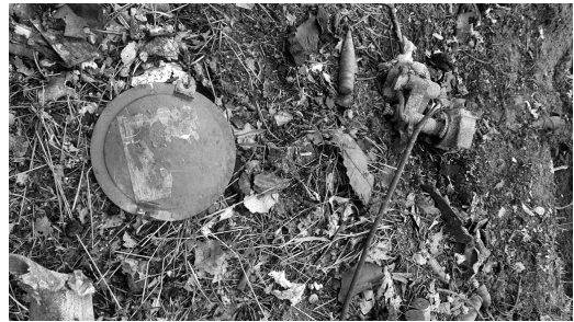
Рис. 15. Фото кришка від фари ворожої БМП-2