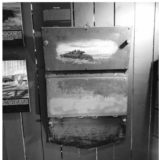
Рис. 16. Художня робота «Кінцева зупинка»