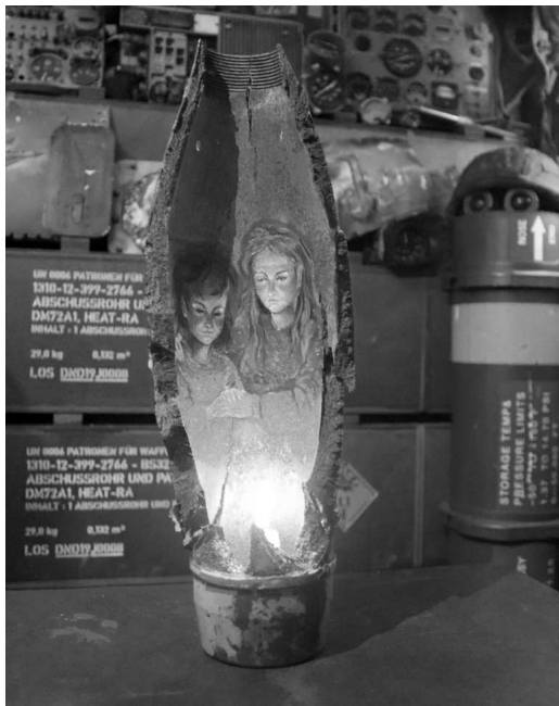
Рис. 7. Художня робота «Світло нашої перемоги»