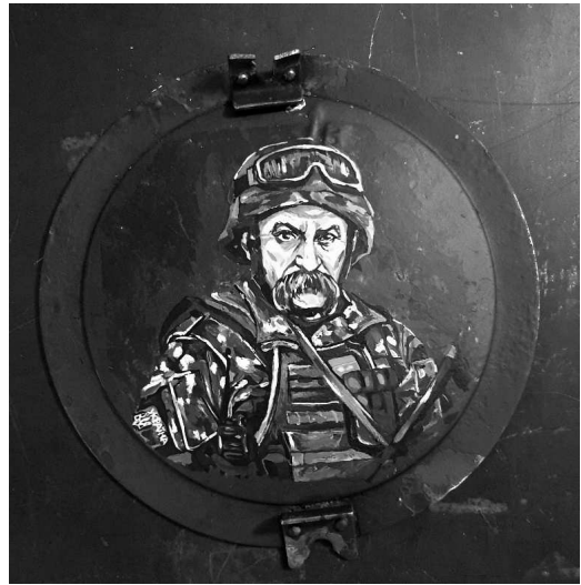
Рис. 14. Художня робота «Борітеся – поборете!»

За даними видання Лондонського міжнародного інституту стратегічних досліджень The Military Balance, збройні сили Російської Федерації у 2021 р. мали на озброєнні близько 3300 танків усіх типів, а також 10200