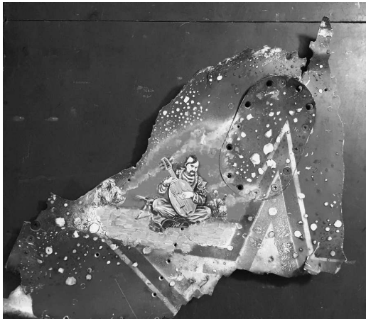
Рис. 6. Художня робота «Козак Мамай»