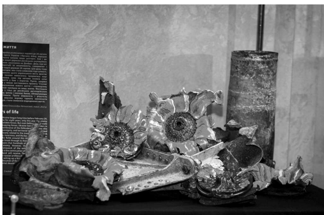
Рис. 10. Мистецька інсталяція «Квіти життя»

Наступну роботу не можна вважати предметом живопису, але це жодним чином не нівелює її мистецької цінності. Ідеться про інсталяцію авторства Павла Нетьосова «М'ясо кур в собственном соку» (рис. 11). Основою для композиції стала так звана «ведуча зірка» від знищеної Силами оборони України на території гостомельського летовища російської МТ-ЛВ (БТ-ЛВ) [22] – багатоцільового легкого броньованого транспортера. Чільне місце мистецької композиції «м'ясо кур в собственном соку» займає звичайна м'ясна консерва з пайка, яким харчуються російські окупанти. Проте в символічному плані