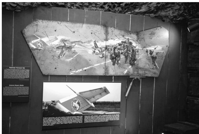
Рис. 3. Художня робота «Аеропорт «Антонов». Бій»