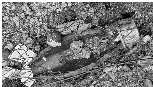
Рис. 8. Фото уламка снаряда російської гармати Д-30

Наступна робота – «Козак Мамай» (рис. 6) авторства Олександри Нетьосової виконана на уламку російського броньованого штурмового літака Су-25СМ «Грач» [20] з бортовим номером RF-91961. Літак був збитий пілотами 40-ї бригади тактичної авіації в районі села Вишеград Київської області [21]. Уламки ворожого літака були виявлені в рамках експедиції з комплектування музейного фонду музейно-експедиційною групою НУОУ. Козак Мамай був збірним символічним образом і мистецьким утіленням народних романтичних уявлень про добу козацтва. У народному розумінні козак – це благородний лицар і борець за справедливість. Прагнення справедливості та ностальгічні спогади про славетну минувшину стимулювали народних митців апелювати до цього образу та втілювати його в різних варіаціях. Саме тема боротьби за свободу і справедливість є глибинною в мистецькому осмисленні образу козака Мамаю.