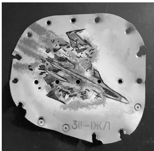
Рис. 5. Художня робота «Заслужена кара»