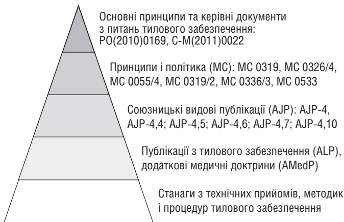
Рис. 1. Ієрархія нормативних документів НАТО

багатонаціональних військово-морських сил, ALP-4.2 Доктрина тилового забезпечення сухопутних військ, ALP-4.3 Доктрина та процедури тилового забезпечення повітряних сил, а також додаткові медичні доктрини: AMedP-1 Медичне планування, AMedP-2 Медична евакуація тощо.