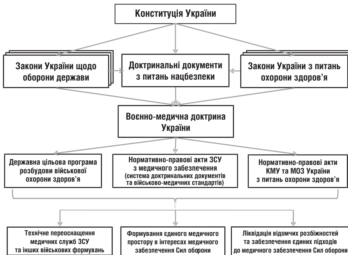
Рис. 4. Місце та роль Воєнно-медичної доктрини України в системі законодавчих і нормативно-правових актів держави з питань військової охорони здоров'я

Принципи і політика враховують сучасні досягнення медицини та визначають основні принципи охорони здоров'я військовослужбовців і медичного забезпечення військ (сил) (оперативні принципи), а також містять концептуальні положення щодо медичного забезпечення військ (сил), які мають використовуватися під час розроблення національних доктрин, концепцій, планів і процедур. Крім того, їхні положення мають ураховуватися під час прийняття оперативних рішень щодо медичного забезпечення військ (сил) у мирний і воєнний час, включаючи миротворчі та гуманітарні операції, місії примушування до миру тощо.