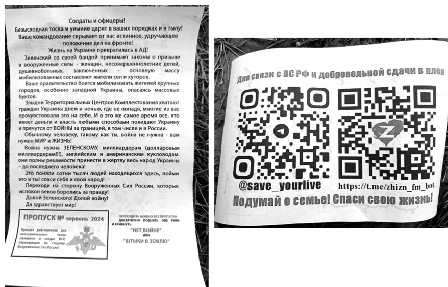
Рисунок 4. Типова листівка противника на Харківському напрямку

Достатньо часто противник намагається закидати листівками позиції сил оборони України, використовуючи агітаційні боеприпаси (снаряди та міни) та безпілотні літальні апарати. Зміст листівок повністю повторює нарративи та меседжі російської пропаганди: «насилницька» мобілізація, залежність української влади від країн Заходу, зв'язок нашого керівництва з олігархами, сумна ситуація в Україні тощо (рис. 4). У своїх листівках противник закликає наш особовий