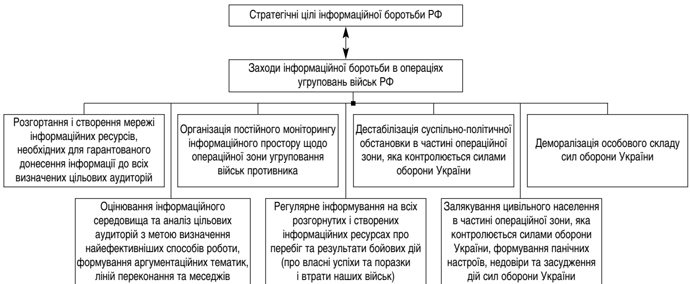
Рис. 3. Система заходів інформаційної боротьби в операціях угруповань військ противника

Так, в операційній зоні ОСУВ «Одеса», проти якого противник проводив операцію силами свого стратегічного угруповання «Дніпр» і частково силами стратегічного угруповання «Юг», на Херсонському напрямку ним були створені та використовувалися телеграм-канали: