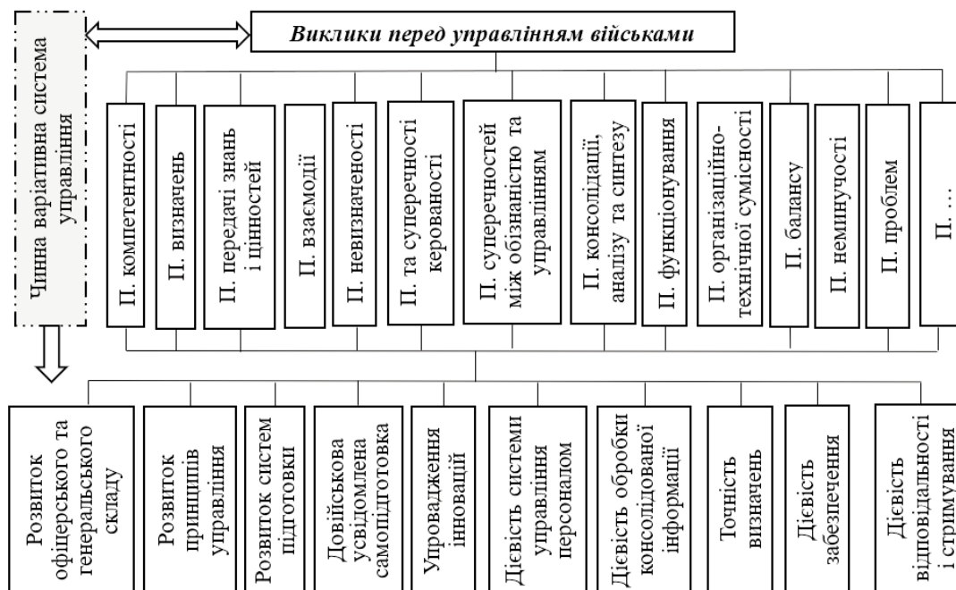
Рис. 2. Проблеми в управлінні військами на сучасному етапі розвитку військового мистецтва та можливі шляхи їх розв'язання

І система-із-систем, і консолідована інформація та її обробка, по суті, не є чимось новим, просто підходи до їх розуміння можуть відрізнятися, наприклад як це сформульовано в авторитетних джерелах на кшталт [19].