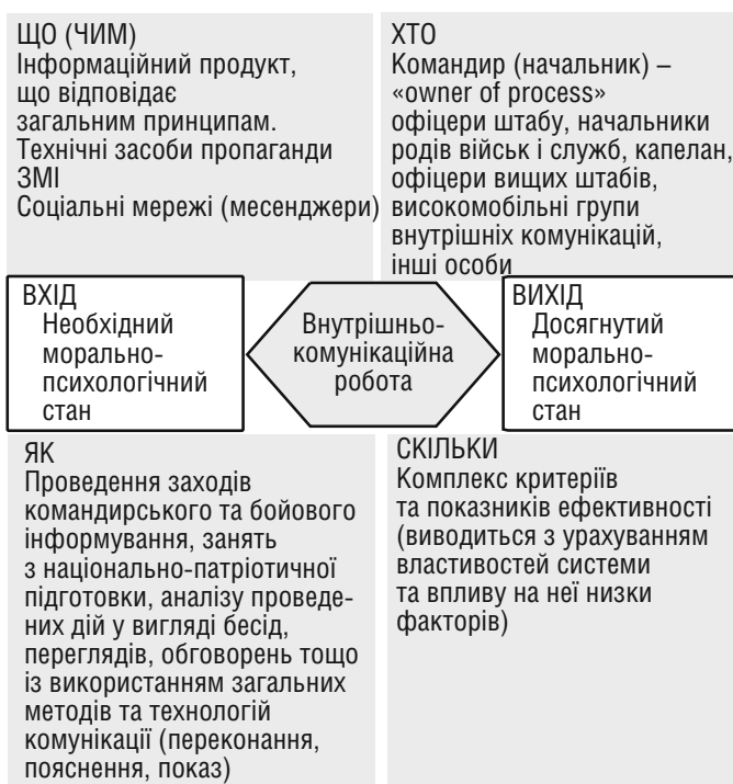
Рис. 3. Схематичне зображення системи внутрішньокommунікаційної роботи

Таким чином, урахувавши детальний опис елементів системи, зв'язків між ними, можна дійти висновку, що система внутрішньокommунікаційної роботи – це сукупність взаємопов'язаних сил, засобів, технологій та методик, необхідних для організації комунікаційних процесів, які діють за єдиними принципами, та спрямованих на формування довіри до військово-політичного керівництва та командирів (начальників), готовності до виконання завдань, формування, підтримання і відновлення морально-психологічного стану. Схематично система внутрішньокommунікаційної роботи представлена на рисунку 3 .