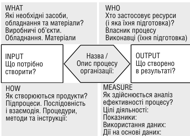
Рис. 2. Схематичне зображення методу, який застосовується Terrapene Process Management Suite™

Головною метою внутрішньокommунікаційної роботи є формування довіри до військово-політичного керівництва держави та військового командування, встановлення