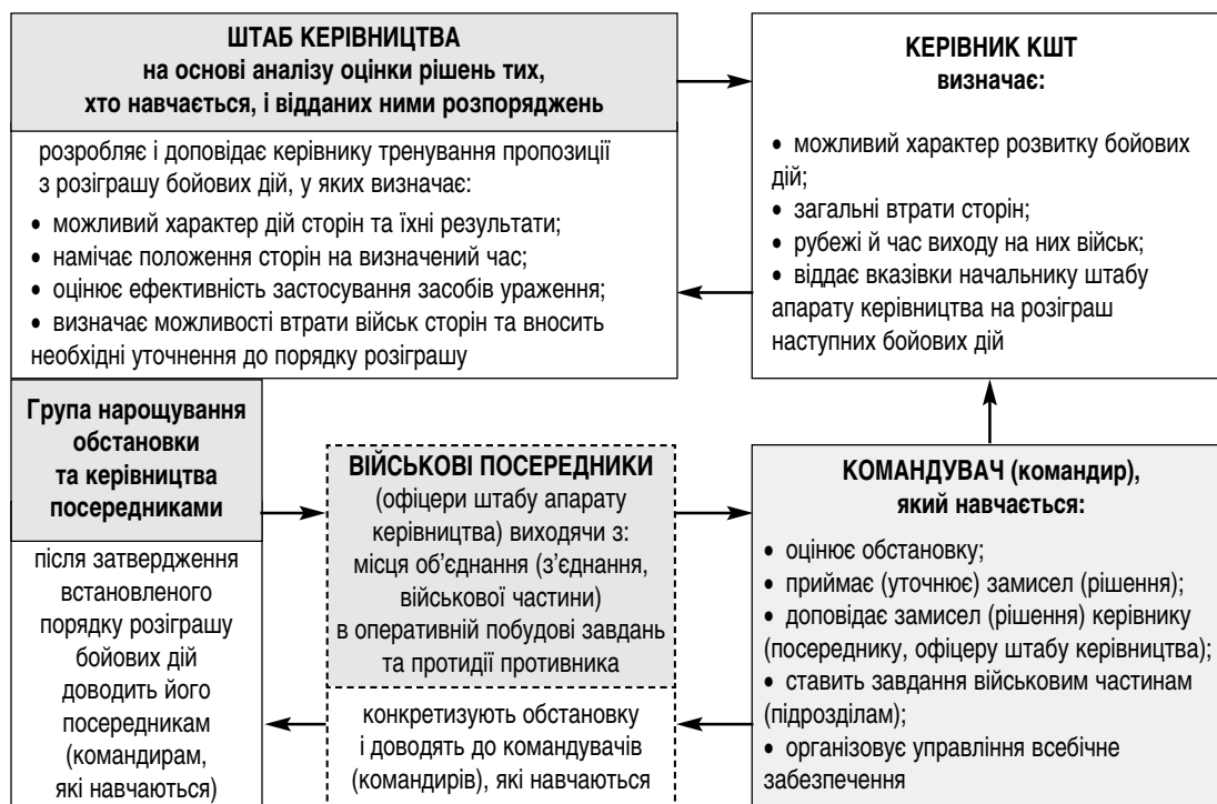
Рис. 2. Порядок нарощування обстановки та розіграшу бойових дій у процесі проведення КШП (варіант)

Для навчання офіцерів ОВУ здійснювати управління військами в різних умовах оперативної обстановки доцільно в процесі тренування ускладнювати її шляхом доведення обстановки оперативних стрибків (один-два оперативні стрибки), незалежно від терміну проведення КШП. Доцільно, щоб обстановка оперативних стрибків відповідала реальній оперативній обстановці на стратегічному напрямку імовірного застосування тих, хто навчається [2].